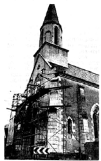
Les travaux entrepris étaient urgents

La Sauvegarde de l'art français (une association privée) ne subventionne, elle, que les travaux sur les monuments antérieurs au XIX e siècle et l'église date de 1853. Et il y avait réellement urgence comme l'a constaté l'artisan choisi, puisqu'il a été obligé d'étayer le fronton du portail.