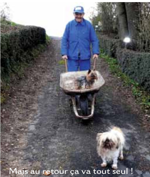
Mais au retour ça va tout seul !

La graine de chènevis (chanvre) a besoin d'un terrain humide pour germer. Le sol alluvial et fertile des varences, les crues de printemps à la fonte des neiges donnent au chanvre les conditions idéales pour atteindre, en 3 ou 4 mois, trois mètres de haut. Le Cher et l'Indre fournissent l'eau nécessaire au rouissage.