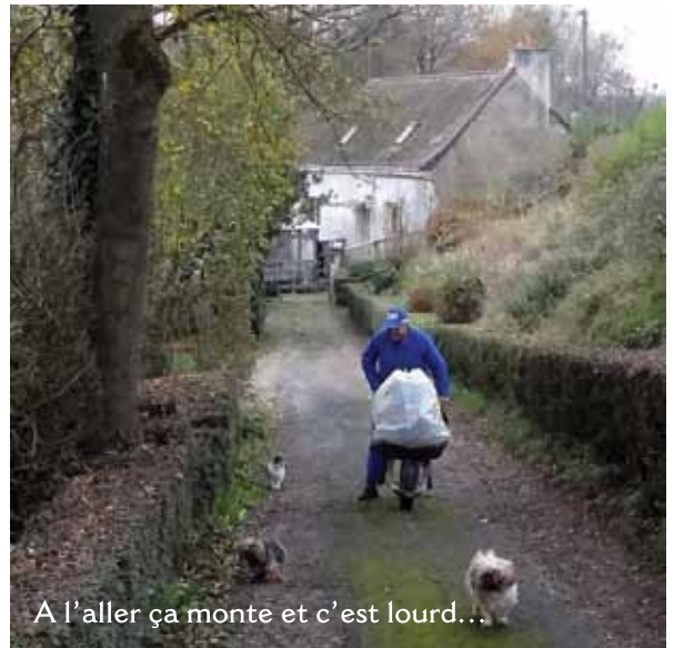
A l'aller ça monte et c'est lourd...

Norbert grandit à la ferme des parents pendant la guerre