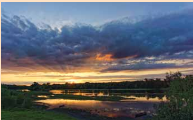
3 e PRIX : Thierry BAGUR « Soleil d'hiver »

Cinquième édition du concours de photographie, avec cette année pour thème « Les quatre saisons ».