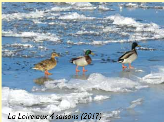
La Loire aux 4 saisons (2017)