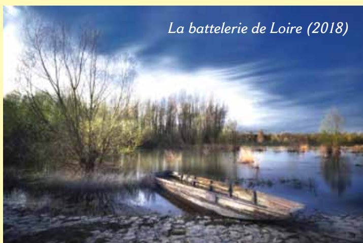
La battellerie de Loire (2018)